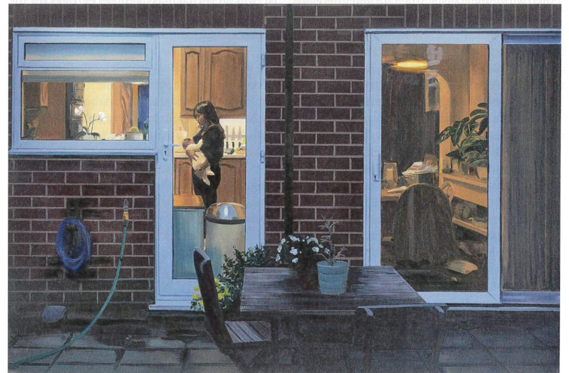
Bilder S. 20/21 und S. 23 oben: Fine Art Images / Heritage Images / Getty Images; S. 23 unten: Caroline Walker, Roundmoor Drive, 2022 © 2026, ProLitteris, Zürich