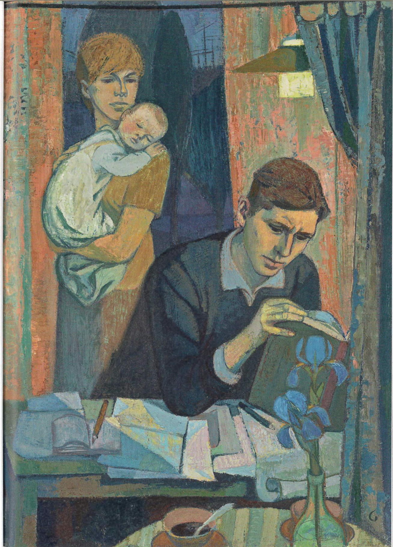
Bilder: Hannah Höch, Frau und Saturn , 1922 © 2026, ProLitteris, Zürich; Erich Gerlach, Im Zwiellicht , 1965/66 © 2026, ProLitteris, Zürich